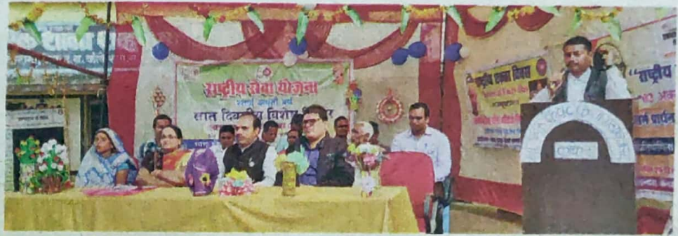
शिविर को विशिष्ट जनों ने भी संबोधित किया।